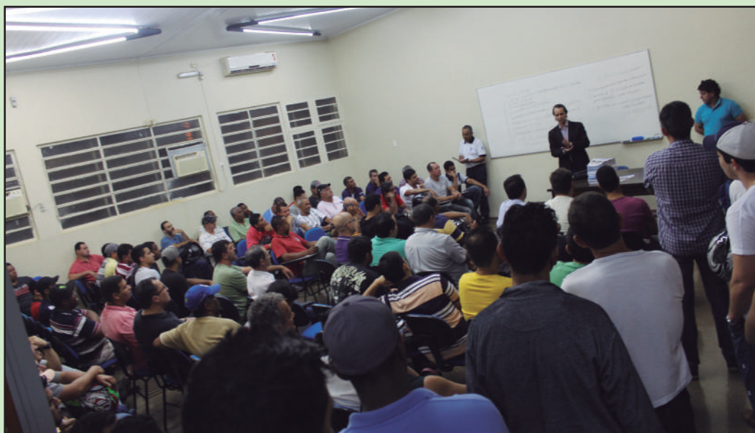
Demitidos da Simisa se reúnem com diretoria e jurídico do sindicato

Até o fechamento dessa edição, nada tinha sido definido pela justiça. ●